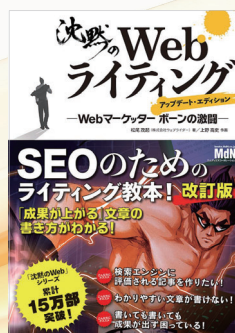
沈黙のWebライティング